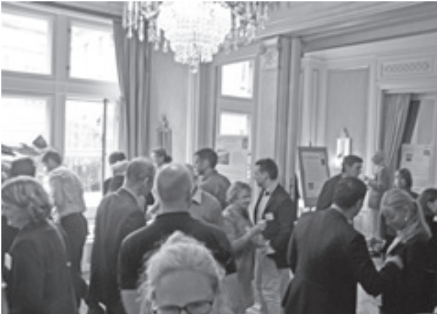
Mingel på IVA